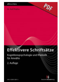
Effektivere Schriftsätze -