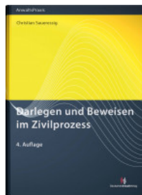
Darlegen und Beweisen im