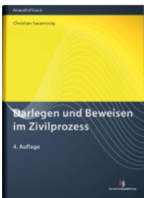
Darlegen und Beweisen im